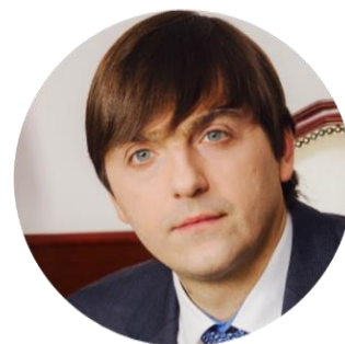
Министр просвещения РФ Сергей Сергеевич Кравцов

«Необходимо переосмыслить существующую систему педагогического образования, чтобы освободить время для творческой работы учителя с детьми, убрав излишнюю бюрократическую нагрузку»